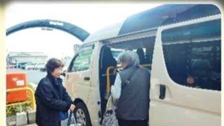
買い物支援【買い物バス】

本会の様々な事業実施のため、 今年度も多くの皆様のご協力をよろしくお願いいたします