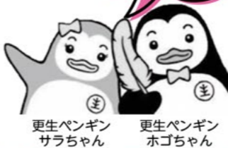
更生ペンギンサラちゃん 更生ペンギンホゴちゃん

応募された人には もれなく ホゴちゃんサラちゃん のクリアファイルと プレゼント!