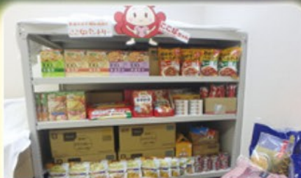
ここなバントリー