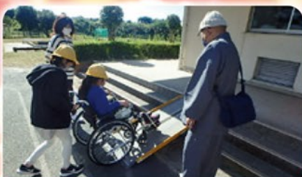
ボランティア・福祉体験教室

本会の様々な事業実施のため、 今年度も多くの皆様のご協力をよろしくお願いいたします