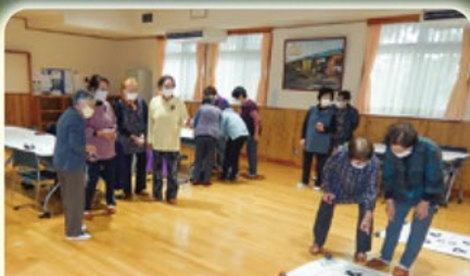
つどいの場支援【茶論(サロン)】【ゴムバンド運動】