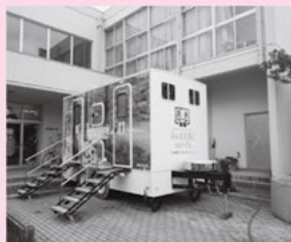
避難所のトイレトレーラー

復興支援は今後も継続して行われると考えます。「東海市にいてもできる支援」として、東海市社会福祉協議会の窓口に募金箱を設置しています。 *領収書が必要な方は、窓口にて対応いたします。